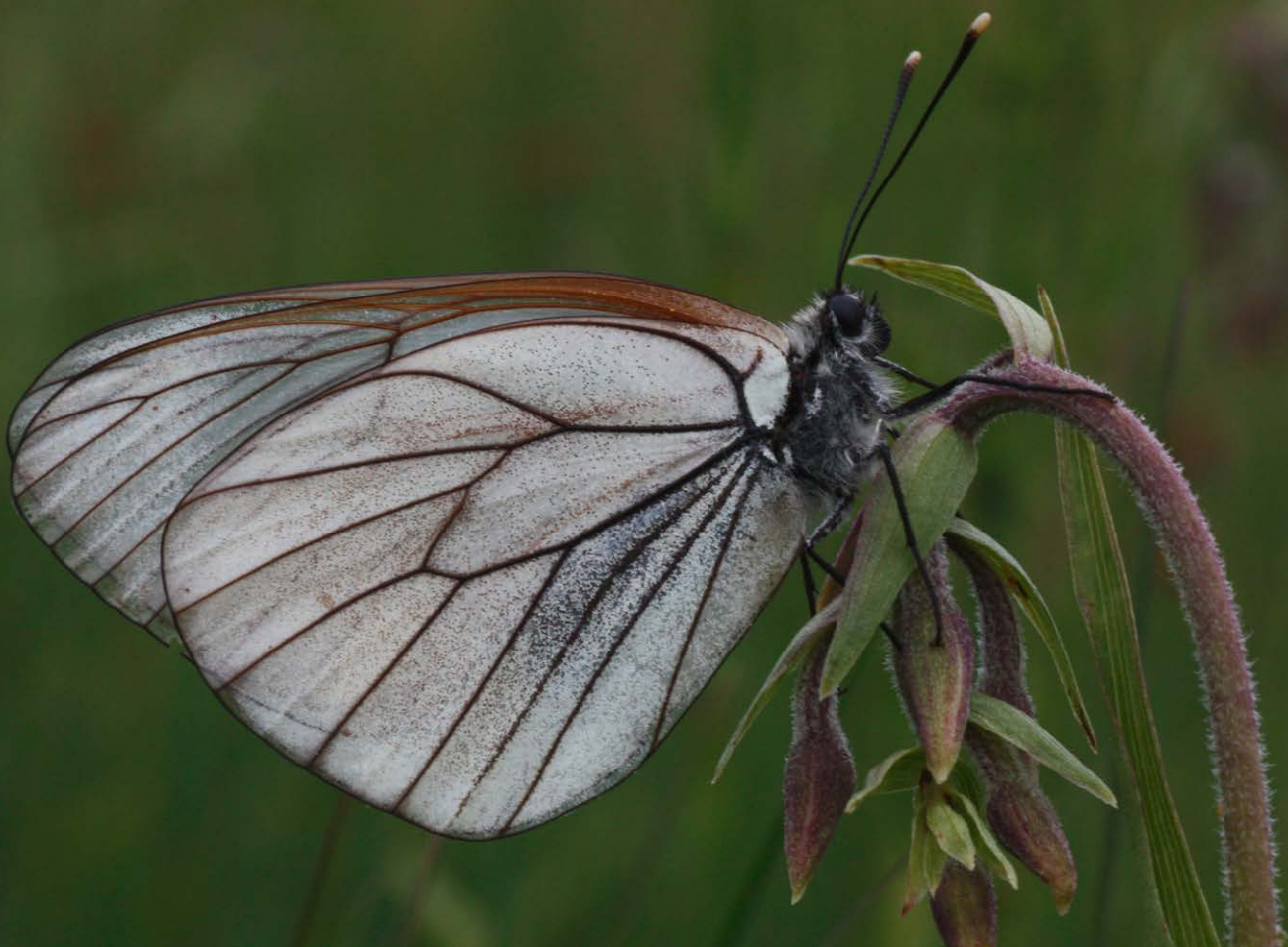
Baumweißlinge in einer artenreichen Feuchtwiese im Naturpark Märkische Schweiz

Brandenburg beherbergt vielfältige Lebensräume des Offenlandes. Hierzu zählen sowohl verschiedene Lebensräume der trockenen Sandheiden und Dünen als auch die der kontinentalen Trocken- und Halbtrockenrasen. Brandenburg verfügt über rund 40 % der Heidefläche Deutschlands und trägt damit eine besondere Verantwortung zur Sicherung und zum Erhalt dieser Flächen. Viele dieser Flä-