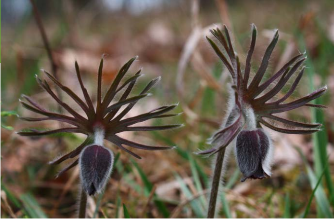
Wiesen-Kuhschelle an den Oderhängen bei Lebus