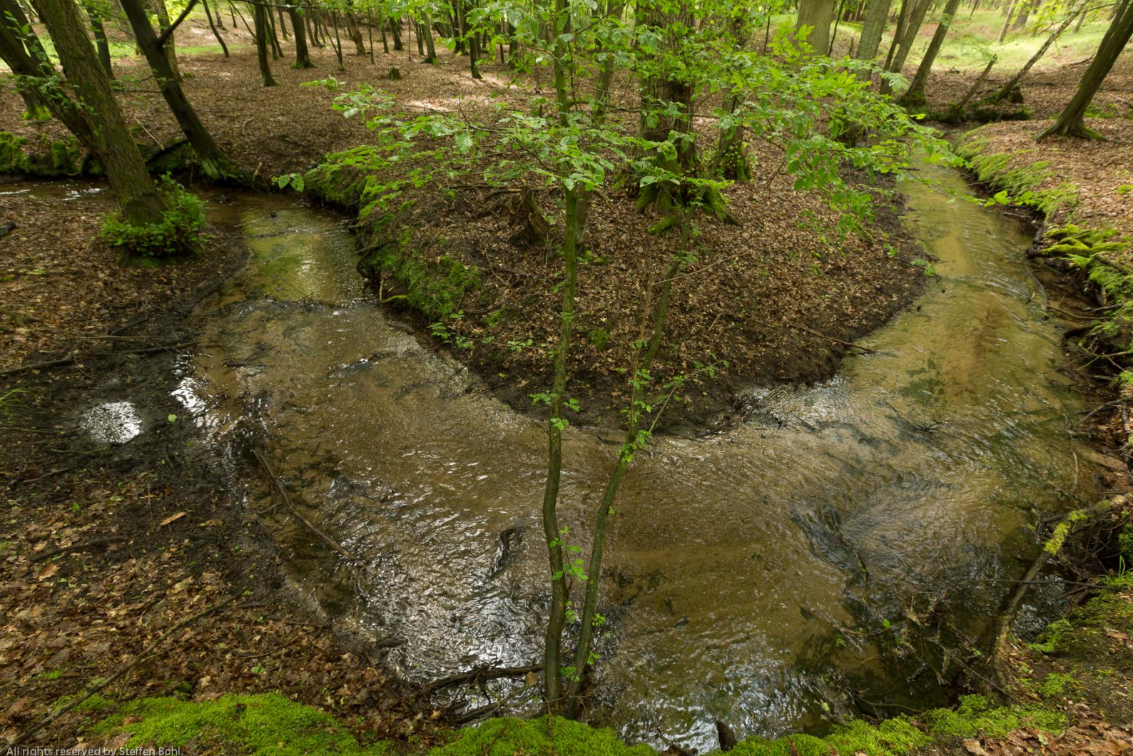
Der frei mäandrierende Polsbach im Naturpark Hoher Fläming ist Teil eines Feuchtgebietsverbundes.

Ein wichtiger Teilaspekt, insbesondere hinsichtlich des Schutzes der an Feuchtgebiete gebundenen Arten und der vom Wasser geprägten Lebensräume, ist neben dem Moorschutz der „Feuchtgebietsverbund“, d.h. ein barrierefreier Verbund von Feuchtgebieten und Gewässern. Hierbei kommt der Revitalisierung von nutzungsfreien Niedermooren, dem Erhalt naturnaher Moore und der Revitalisierung entwässerter Moore, der Wiederherstellung der Verbindung von Fluss und Aue und der Herstellung der ökologischen Durchgängigkeit von Fließgewässern eine besondere Bedeutung zu. Nicht alle Verbindungsflächen müssen als Schutzgebiete ausgewiesen werden. Mit Festlegung eines großräumigen Freiraumverbundes im Landesentwicklungsplan Berlin-Brandenburg (LEP B-B 2009), der neben weiteren hochwertigen Freiräumen alle naturschutzfachlich geschützten Gebiete umfasst, werden auch die für den Biotopverbund notwendigen Flächen überwiegend berücksichtigt. Die für die Biotopverbundfunktion wichtige Durchgän-