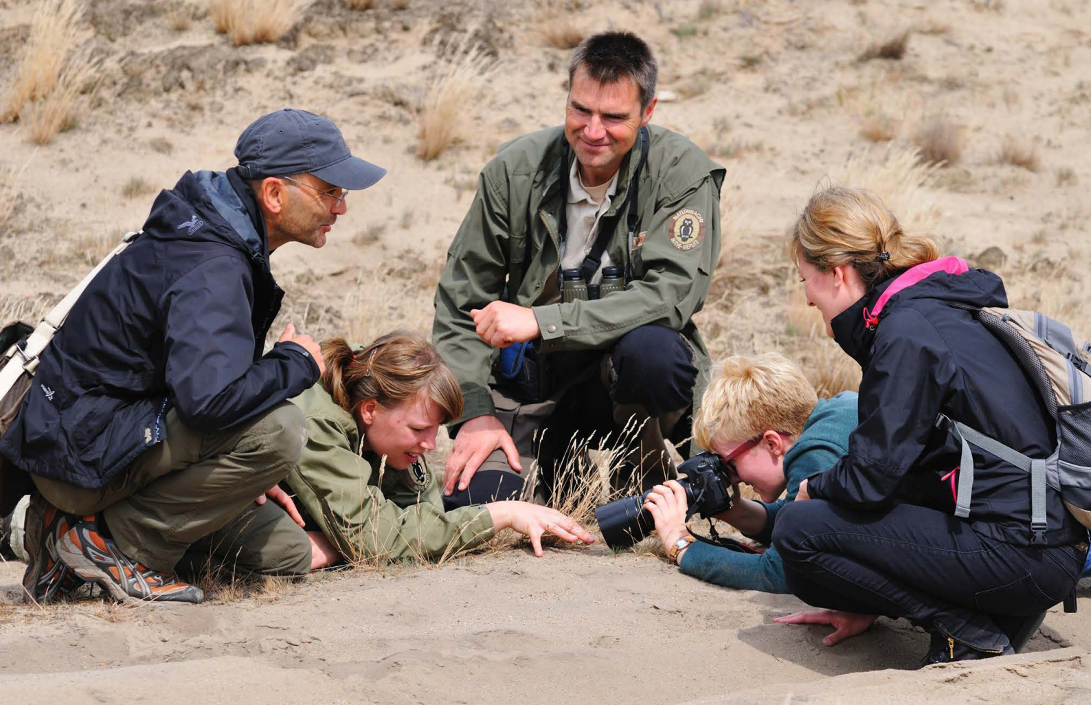
Spannende Perspektiven – Mit den Rangern Natur erleben